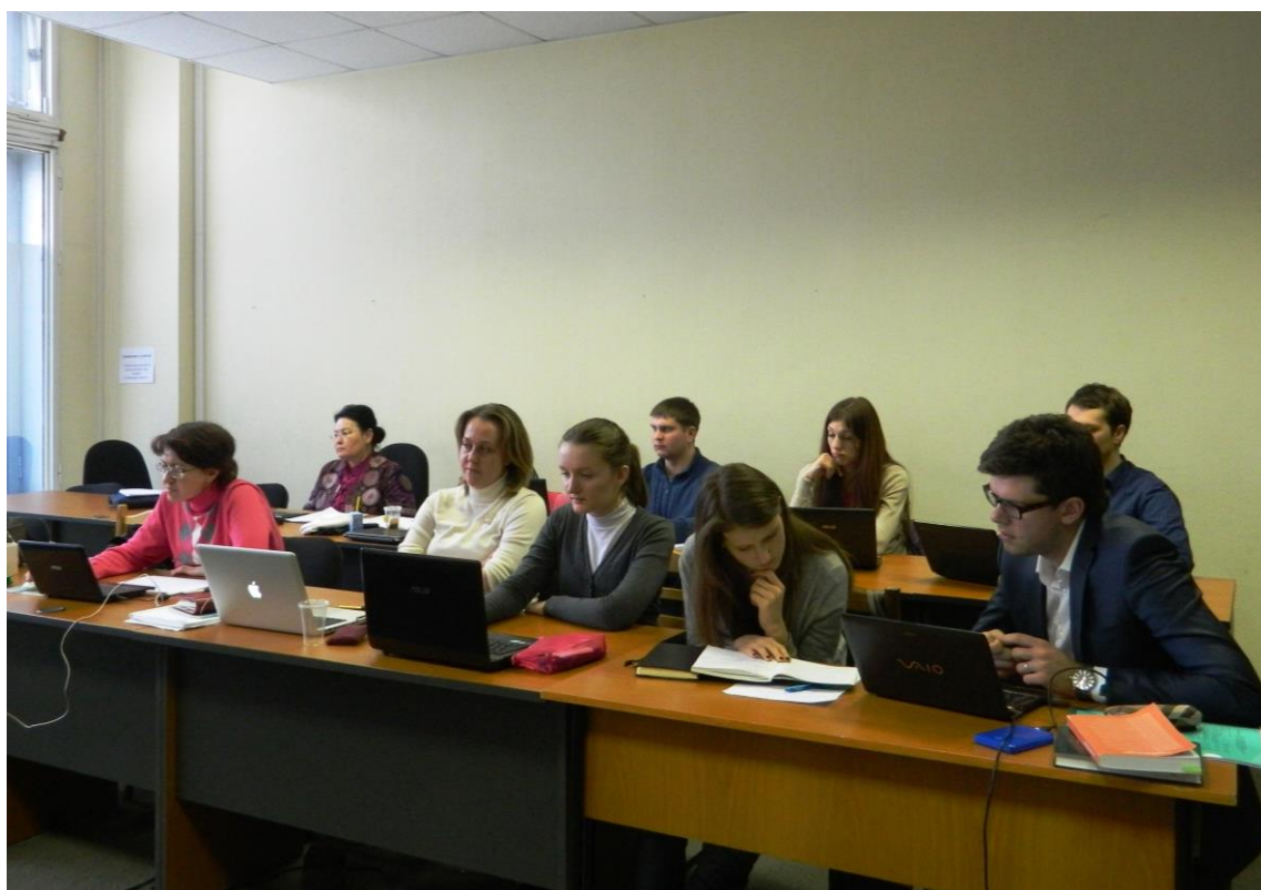
Слушатели курса «Население и здоровье»